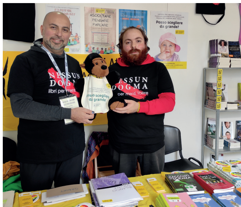
Banchetto a Lucca Comics & Games.