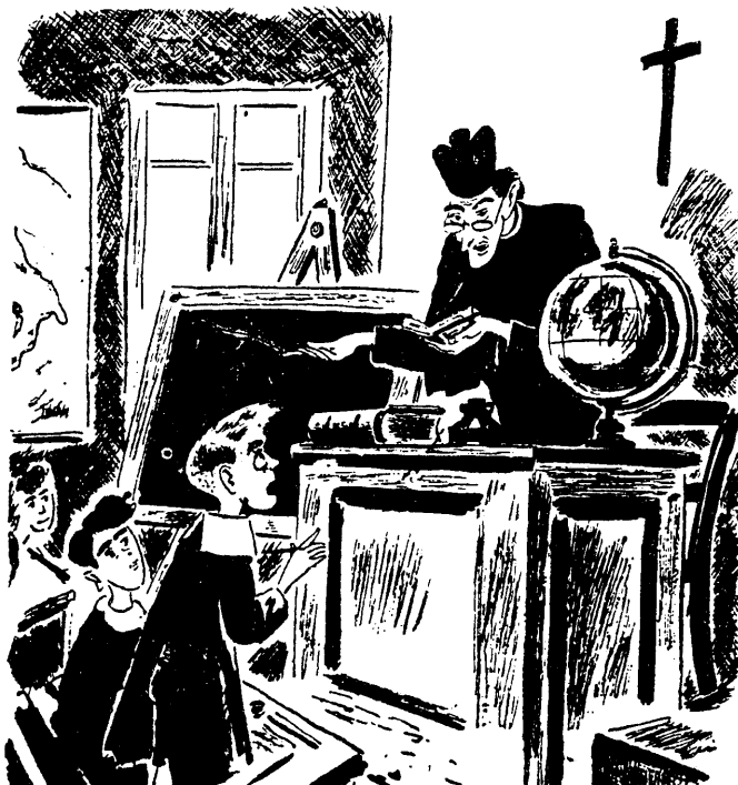
— Signor curato di che è morto Giordano Bruno? — Di una infiammazione.,, 1947 (ARTIGLI)