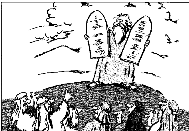
Un attimo, sono un avvocato.

Se i politici invocano la par condicio per le loro diatribe, che dovrebbero dunque fare gli scienziati di fronte all'imperare delle immagini irrazionali nel mondo dell'educazione e dei media? E, soprattutto, come potrebbe il pubblico non credere alla magia o alle superstizioni, se altro non gli viene proposto fin dall'infanzia? E infatti ci crede, a destra e manca, come ha dimostrato in occasione della guerra in Iraq: abboccando in un caso alle favole sulle "armi di distruzioni di massa", e nell'altro alla danza della pioggia nella variante del "digiuno per la pace". Sarà impietoso ricordarlo, ma "idiota" e "cretino" significavano in origine "privato" e "cristiano": lo rammenti non solo chi si fa abbindolare dai richiami delle vere magie, che sono quelle politiche di Bush e Berlusconi e quelle religiose del Papa, ma anche chi se ne lamenta. Perché se alla gente s'imboniscono solo storie, non ci si può poi lamentare che essa dia retta solo ai contastorie.